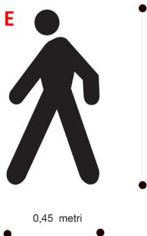
Figura II 442/b Reg. - C.d.S. - Art. 148 PISTA CICLABILE